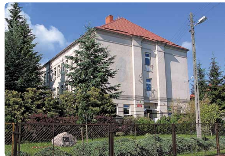
Szkoła Podstawowa im. Jana Brzechwy w Osolinie.

W badaniu ankietowym wzięło udział 47 nauczycieli prowadzących zajęcia pozalekcyjne dla uczniów czterech szkół objętych projektem. Na pytanie: Czy zanim przystąpił/przystąpiła Pan/Pani do projektu pt. Wdrożenie kompleksowych programów rozwojowych 4 szkół w gminie Oborniki Śląskie obejmujących zajęcia dodatkowe, dydaktyczno-wyrównawcze oraz opiekę pedagogiczno-psychologiczną uczniów brała/brał Pani/Pan udział w innych projektach edukacyjnych współfinansowanych ze środków Unii Europejskiej twierdząco odpowiedziało tylko 7 osób (realizacja projektu SMOK).